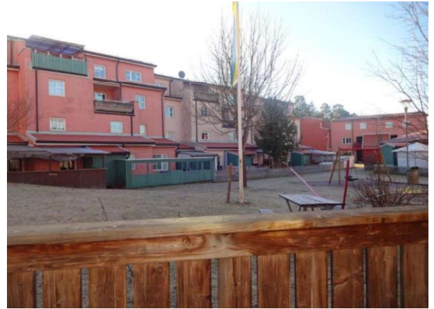
Utsikt från uteplatsen på baksidan