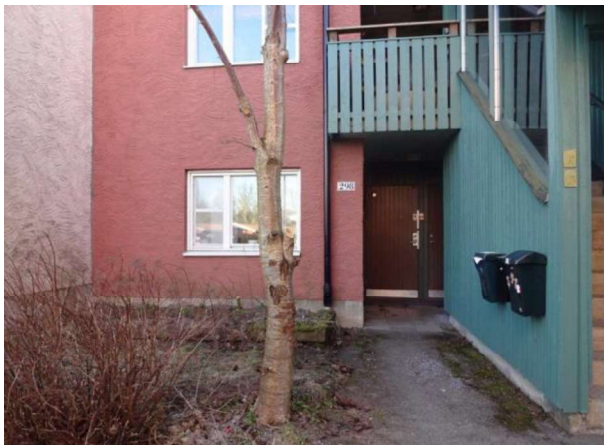
Grästäppa och rabatt på framsidan