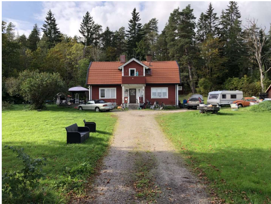
Foto taget utvändigt på värderingsobjektet.