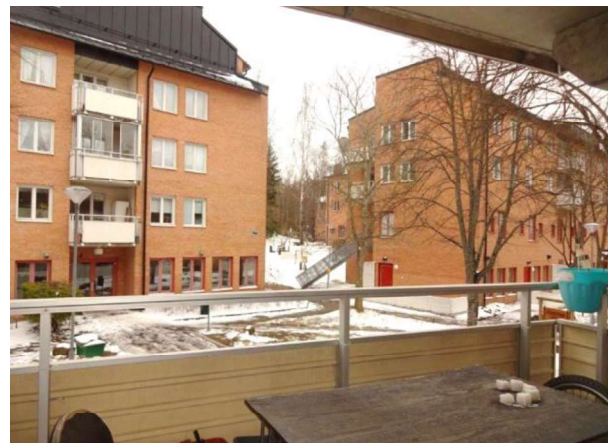
Utsikt från balkongen