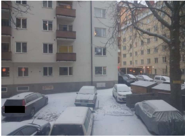
Utsikt från allrummet