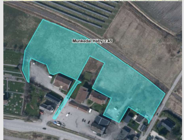
Utdrag ur detaljplan 1430-P86/3