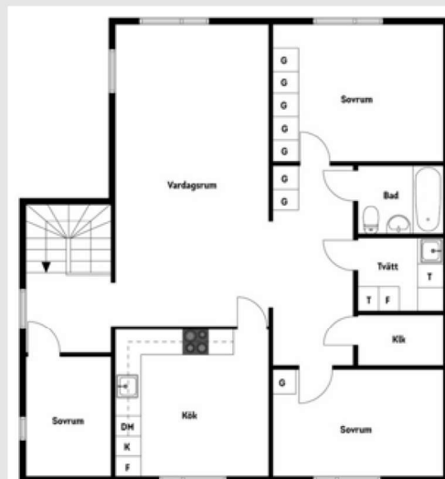
Planskiss från nätet. Avvikelser kan förekomma.