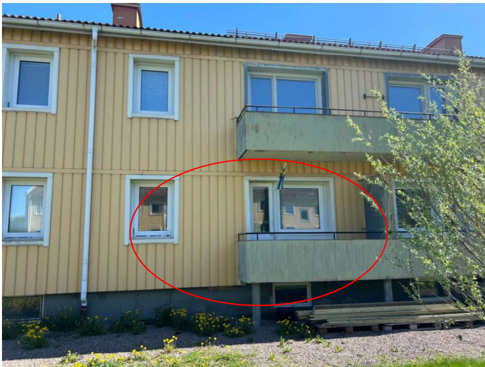
Foto taget utvändigt på värderingsobjektet.

Kommun Avesta Bostadsrättsförening BRF Härden 2 Lägenhet nr Lägenhet nr 1002 Värdetidpunkt Maj 2024