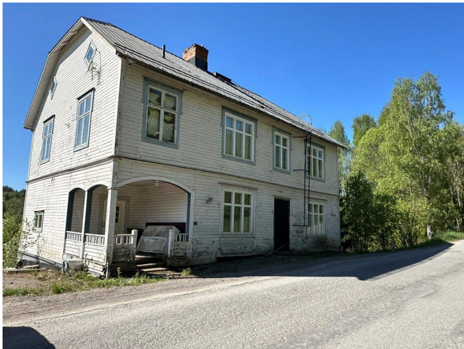
Foto taget utvändigt på värderingsobjektet.