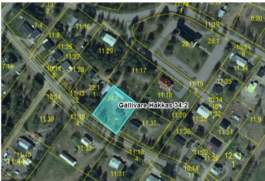
Fastighetsgränser markerade (illustration)