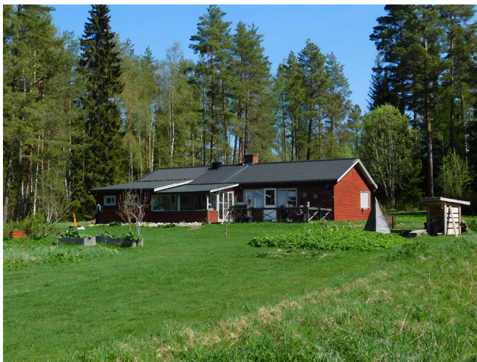
Foto taget utvändigt på värderingsobjektet.