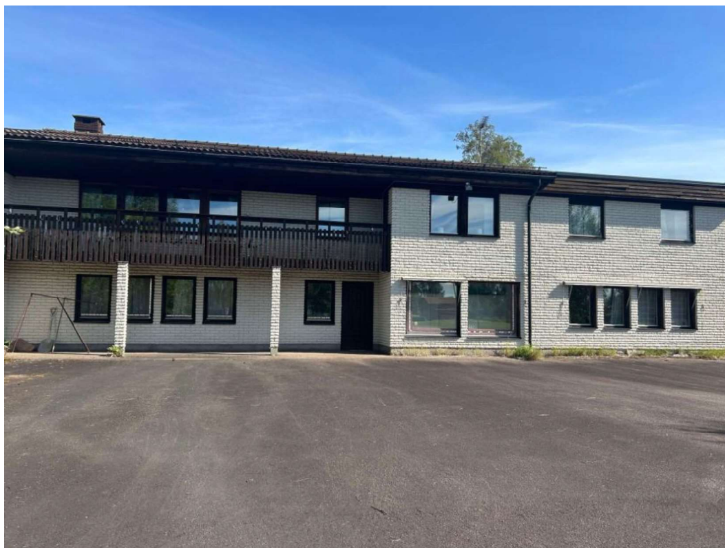
Foto taget utvändigt på värderingsobjektet.