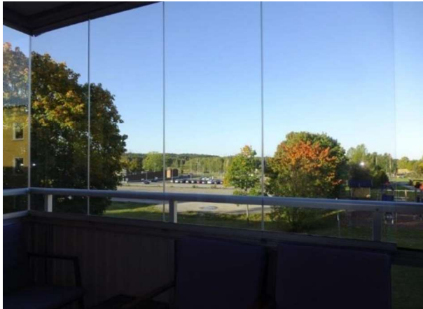
Utsikt från balkongen