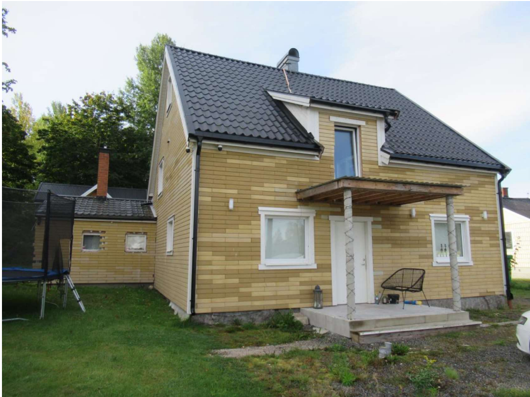
Foto taget utvändigt på värderingsobjektet.