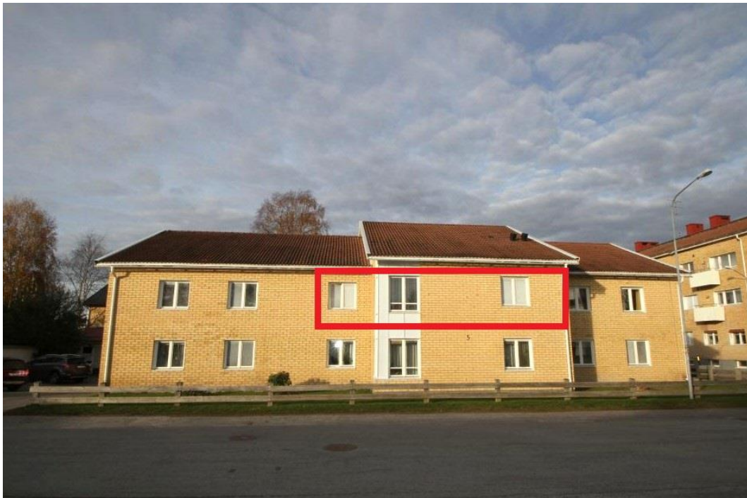
Foto taget utvändigt på värderingsobjektet. Flerbostadshus i två våningar, med gul tegelfasad och vita trädetaljer.