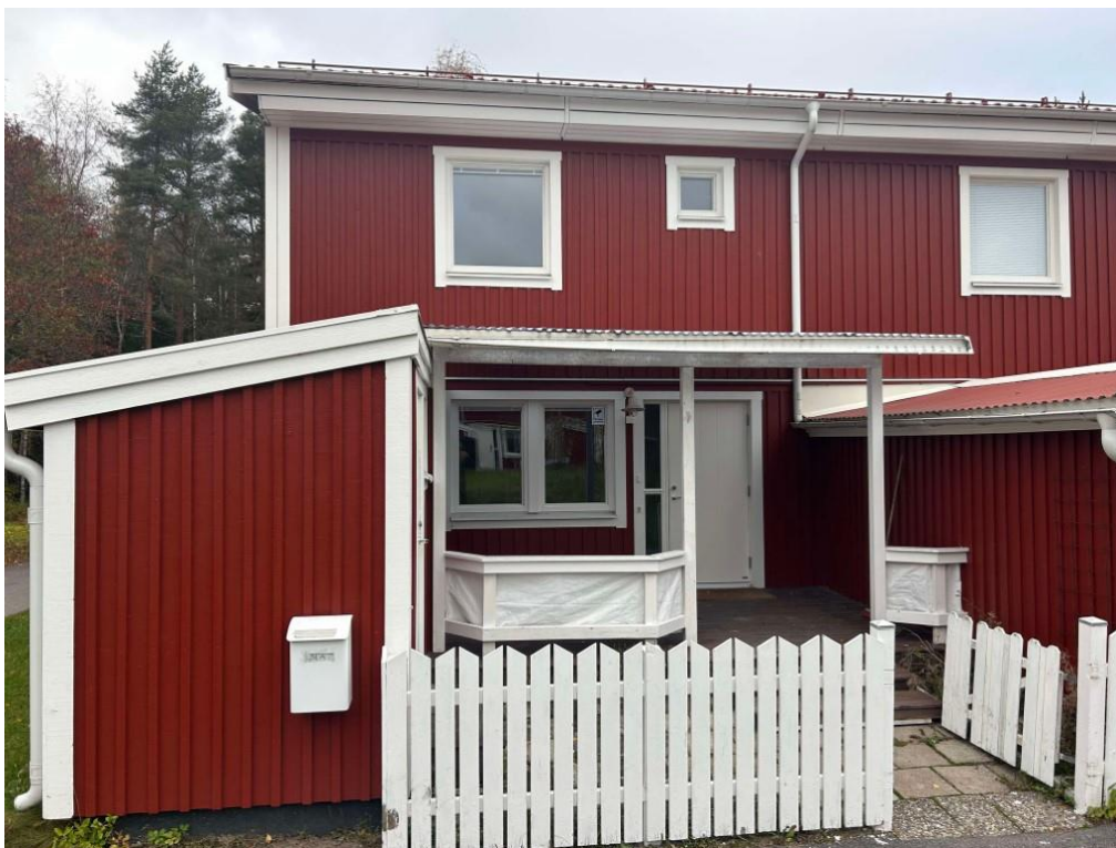
Foto taget utvändigt på värderingsobjektet. Flerbostadshus i två våningar, med rödmålad fasad och vita trädetaljer.

Kommun Gävle Bostadsrättsförening BRF Gävlehus nr 17 Lägenhet nr 203817002-0052 Värdetidpunkt Oktober 2024