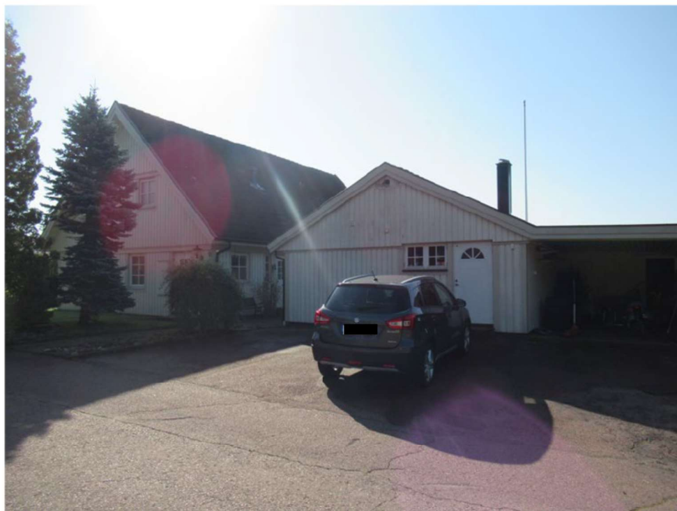
Foto taget utvändigt på värderingsobjektet.