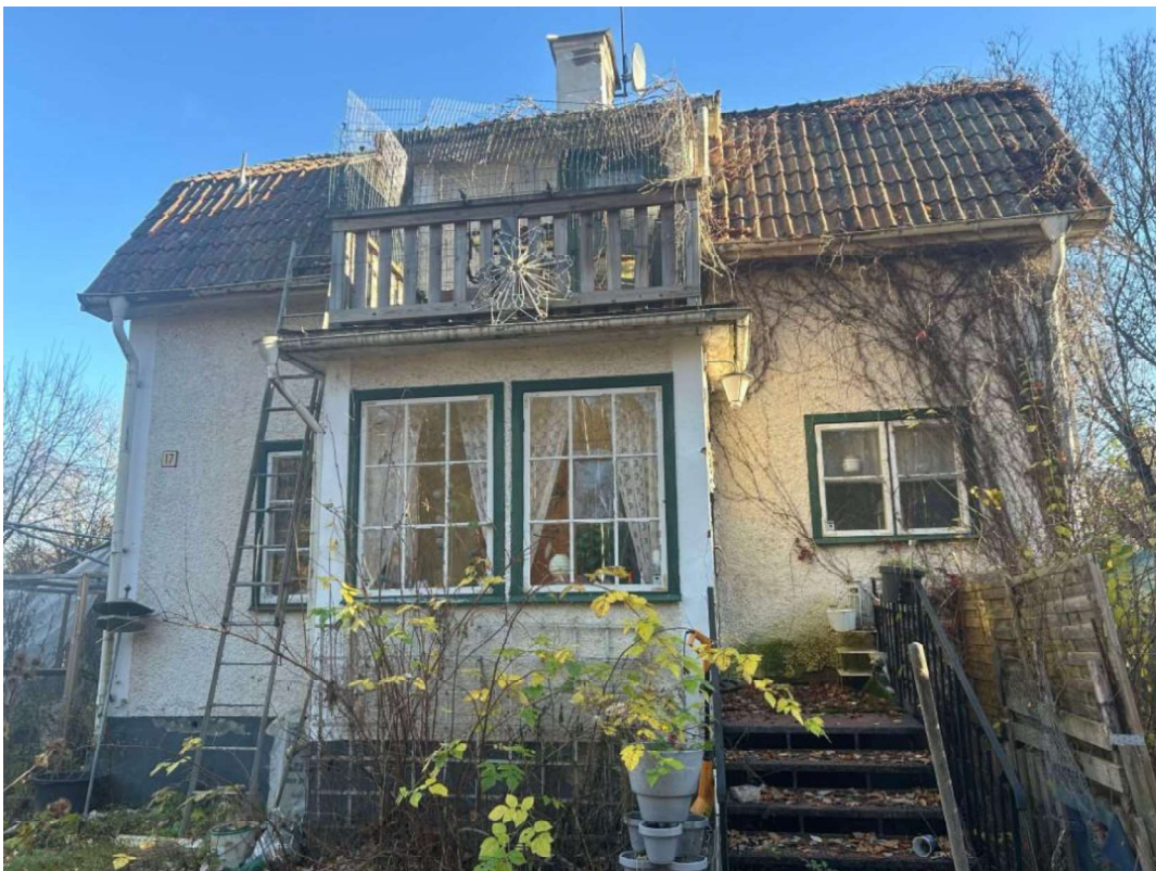
Foto taget utvändigt på värderingsobjektet.