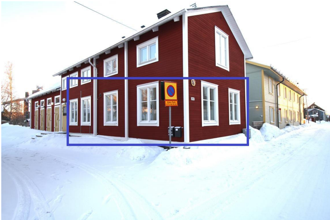
Foto taget utvändigt på värderingsobjektet. Flerbostadshus i två våningar, med röd träfasad och vita trädetaljer.