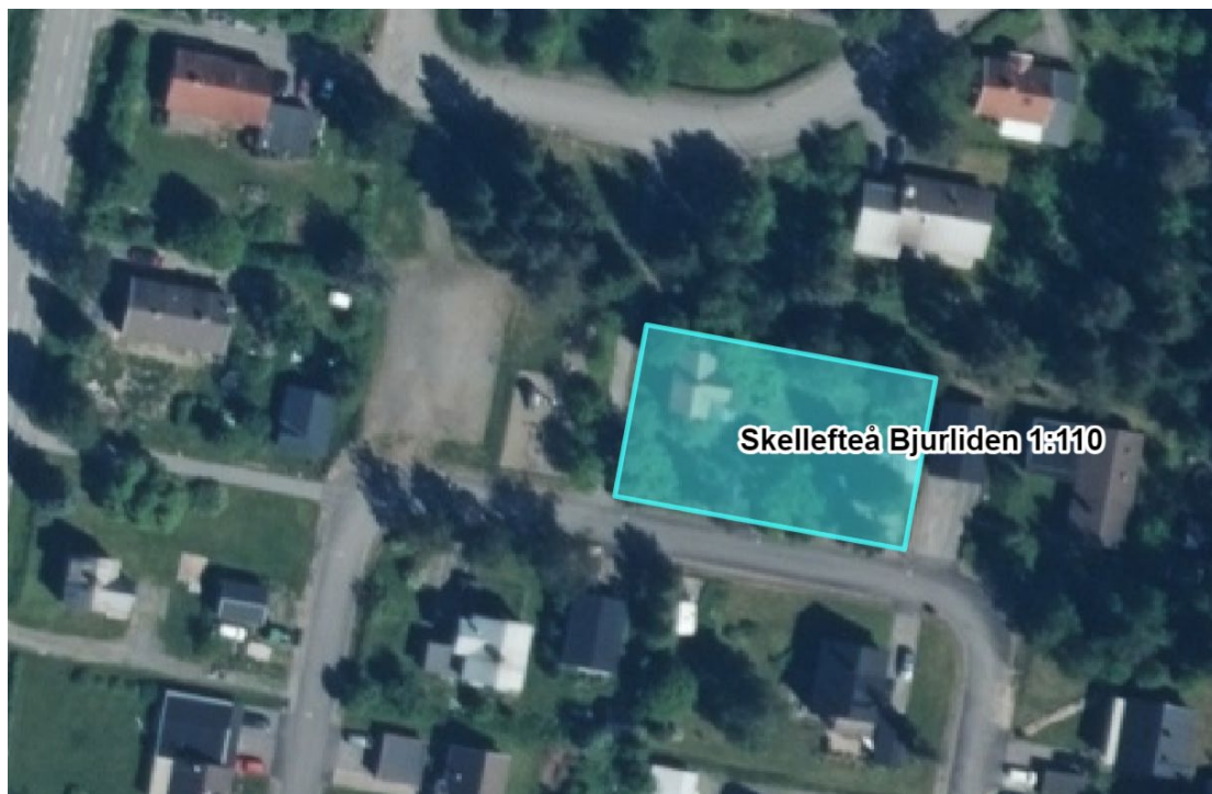
Fastighetens yttre gränser markerade