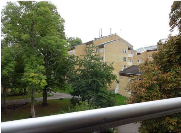
Utsikt från balkongen