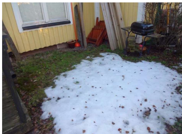
Gräsplätt på framsidan