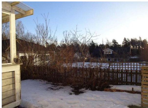
Gräsplätt som nyttjas av lägenheten