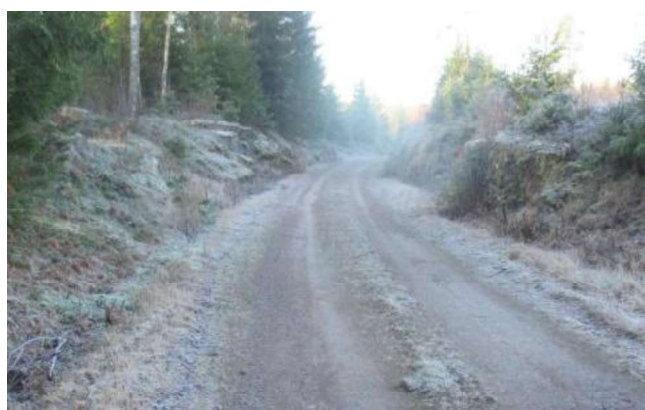
Foto taget utvändigt på grusväg.