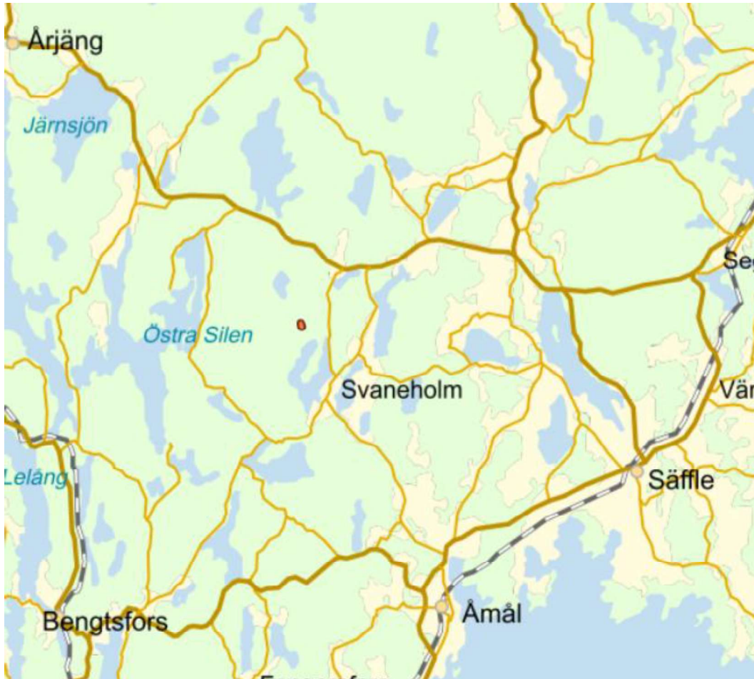
Fastighetskarta. Markeringen visar läge för värderingsobjektet.