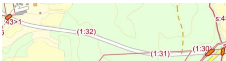
Fastighetskarta. Visar värderingsobjektets utbredningsområde som utgör väg fördelat på Säffle Svanskogs-Hallanda 1:30, 31, 32.