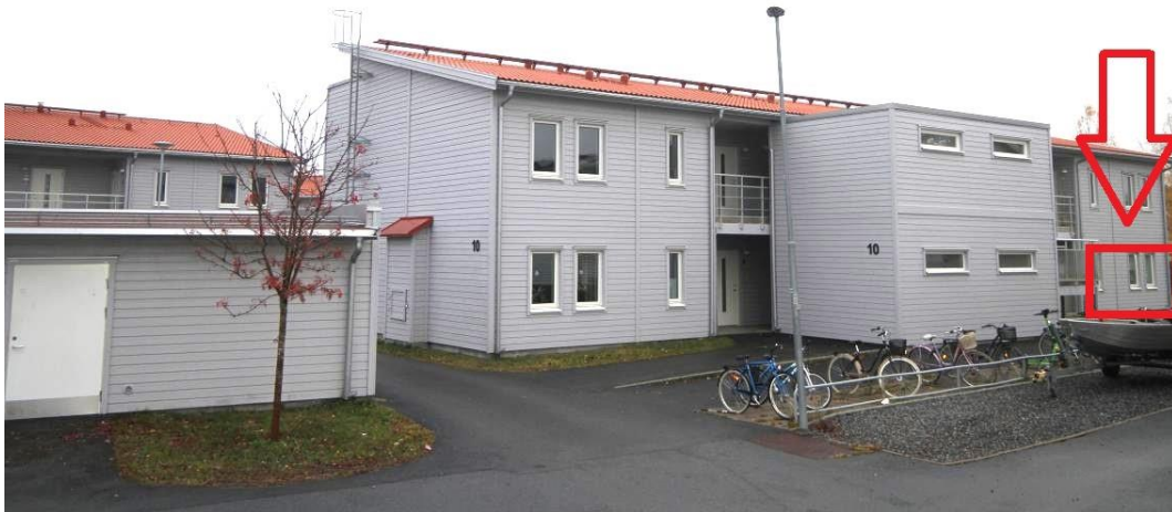
Foto taget utvändigt på värderingsobjektet. Flerbostadshus i två våningar, med gråmålad träfasad och vita trädetaljer.