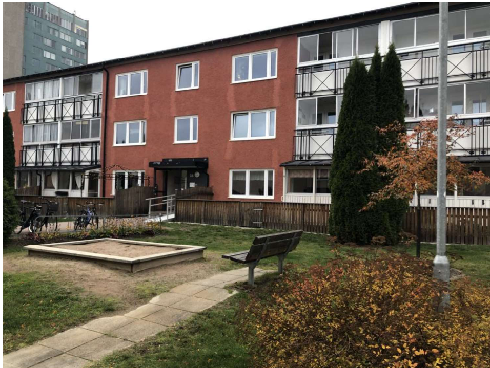
Foto taget utvändigt på värderingsobjektet.