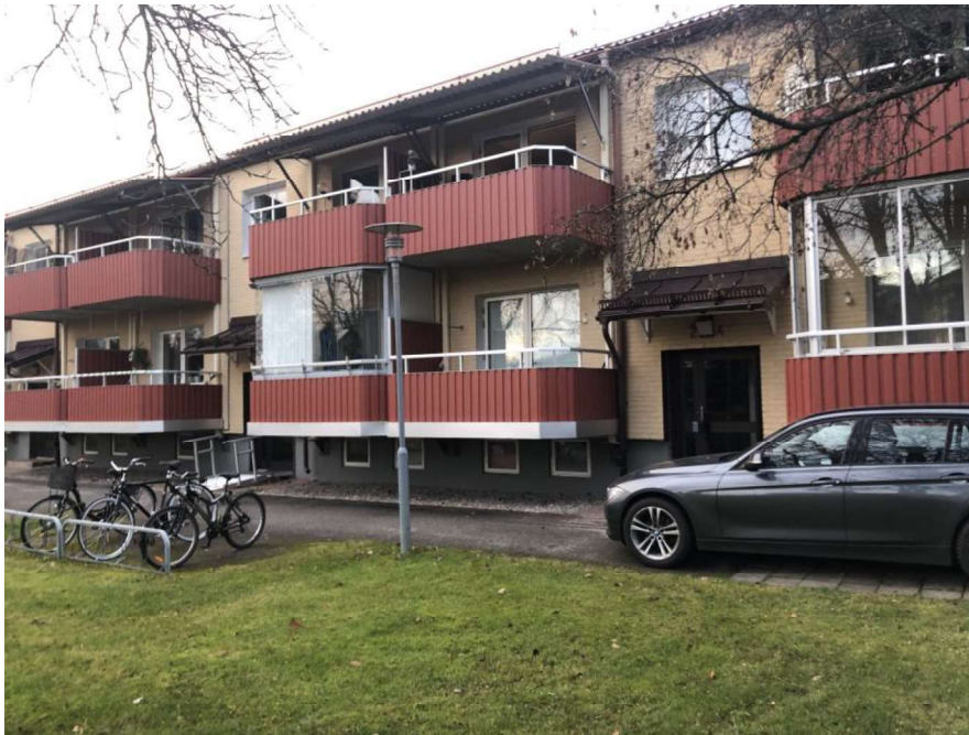
Foto taget utvändigt på värderingsobjektet.