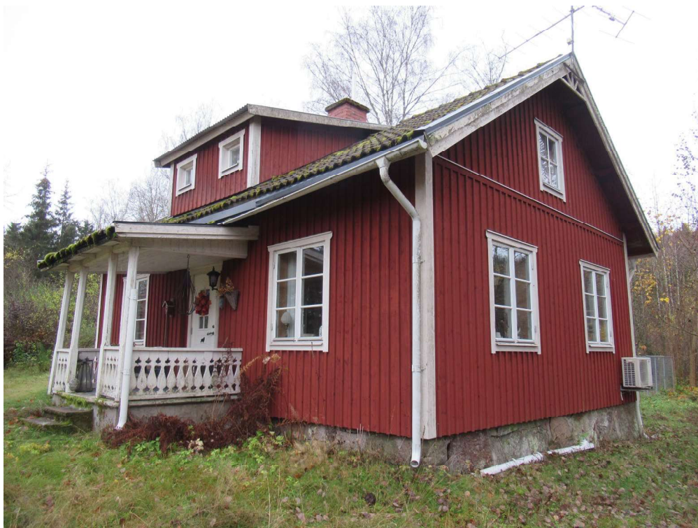
Foto taget utvändigt på värderingsobjektet.